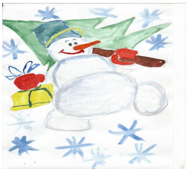
Рисунок Сидорова Алексея (7А класс)

В Муниципальном бюджетном общеобразовательном учреждении «Средняя общеобразовательная школа №3» города Мензелинска Республики Татарстан очень много талантливых учеников, которые пишут интересные рассказы, рисуют замечательные рисунки, сочиняют стихотворения на русском, татарском, английском и немецком языках.