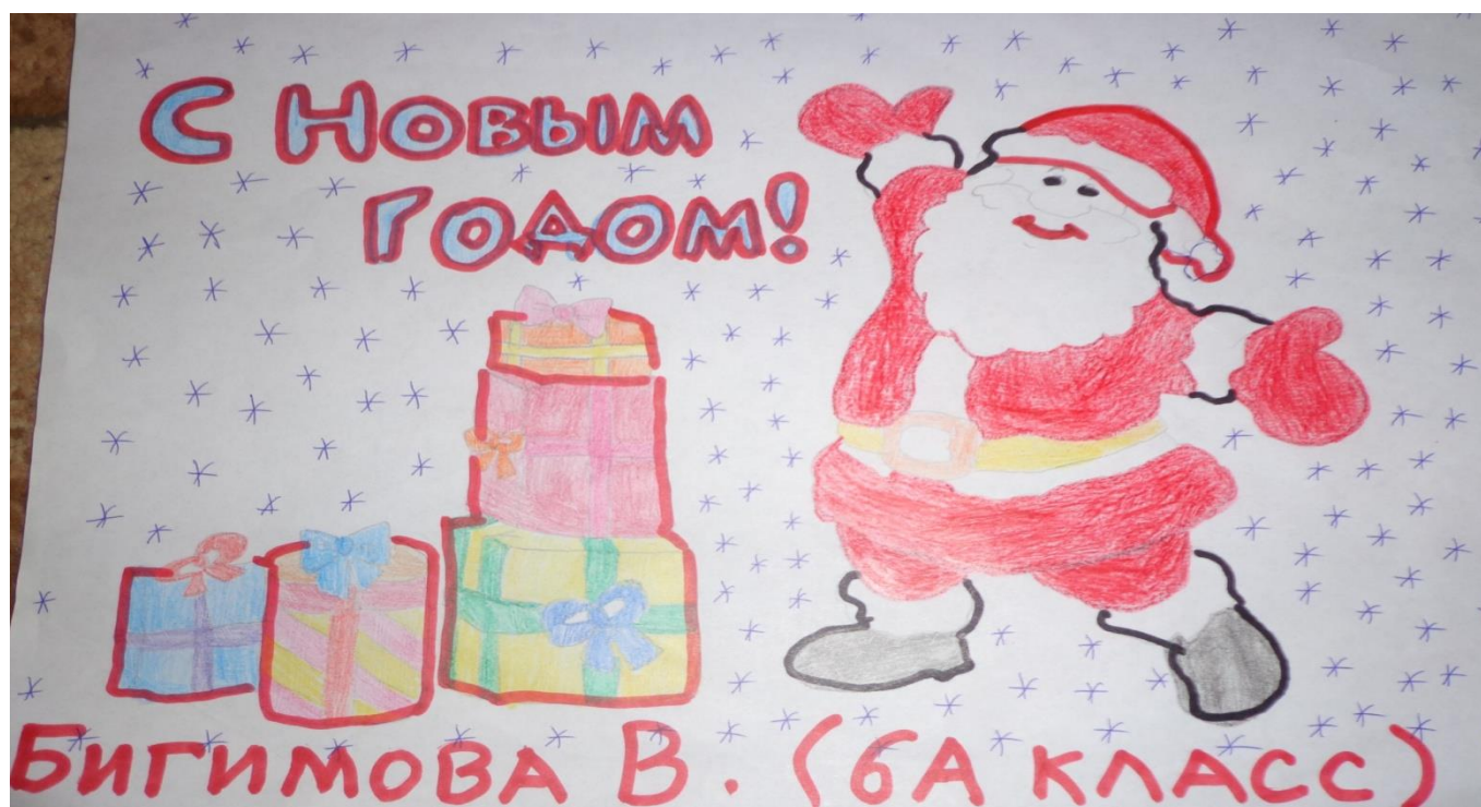
Рисунок Бигимовой Виолетты (6А класс)