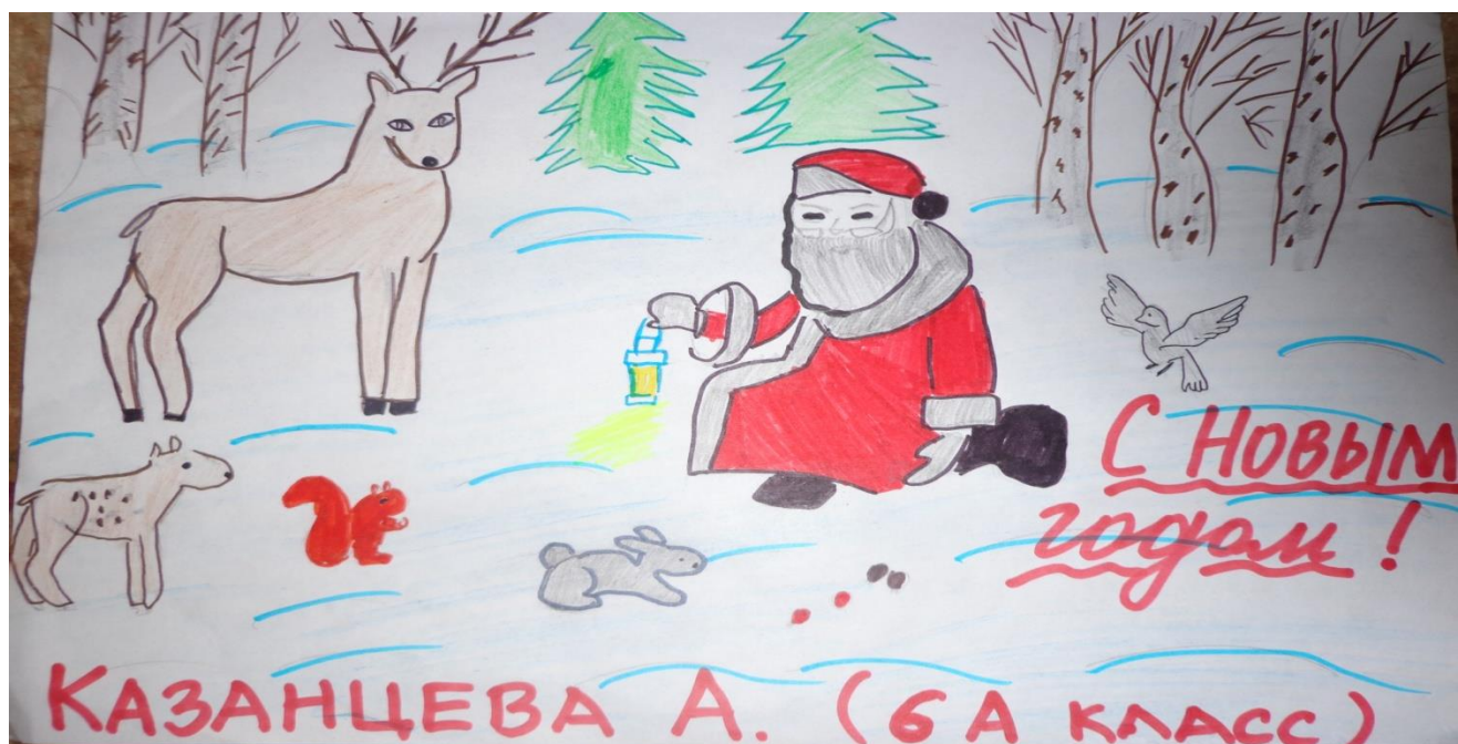
Рисунок Казанцевой Ангелины (6А класс)